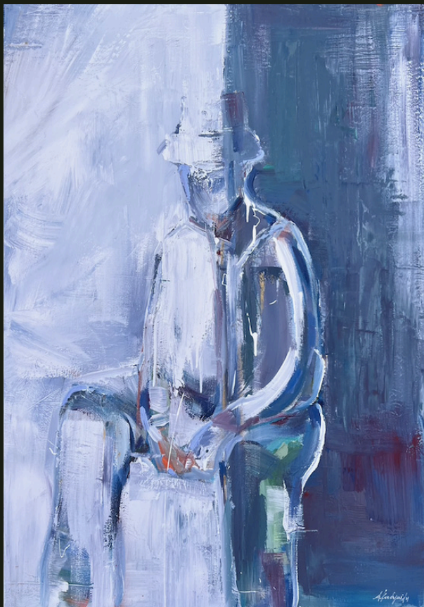
Κι ήμουν στο σκοτάδι. Κι ήμουν το σκοτάδι. Και με είδε μια αχτίδα (2023, Ακρυλικό σε καμβά 100 x 70 εκ.)