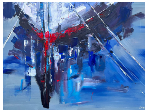
Να φεύγεις! Αθόρυβα (2023, Ακρυλικό σε καμβά 70 x 100 εκ.)