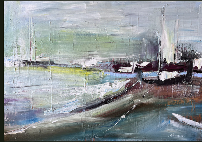
Τα καράβια που φεύγουν για καινούρια ταξίδια (2023, Ακρυλικό σε καμβά 50 x 70 εκ.)

Αγαπάω τ' ό,τι θλιμμένο στον κόσμο, Τα θολά τα ματάκια, τους άρρωστους ανθρώπους, Τα ξερά, γυμνά δέντρα και τα έρημα πάρκα, Τις νεκρές πολιτείες, τους τρισκότεινους τόπους. Τους σκυφτούς οδοιπόρους που μ' ένα δισάκι Για μια πολιτεία μακρινή ξεκινάνε. Τους τυφλούς μουσικούς των πολόβουων δρόμων, Τους φτωχούς, τους αλήτες, αυτούς που πεινάνε Τα χλωμά τα κορίτσια που πάντα προσμένουν Τον ιππότη που είδαν μια βραδιά στο όνειρό τους Να φανεί απ τα βάθη του απέραντου δρόμου Τους κοιμώμενους κόκνους πάνω στ' ασπροφτερό τους Τα καράβια που φεύγουν για καινούρια ταξίδια Και δεν ξέρουν καλά αν θα γυρίσουν ποτέ πίσω Αγαπάω, και θα θελα μαζί τους να πάω, Κι ούτε πια να γυρίσω Αγαπάω τις κλαμένες, ωραίες γυναίκες Που κοιτάνε μακριά, που κοιτάνε θλιμμένα. Αγαπώ σε τούτον τον κόσμο ό, τι κλαίει Γιατί μοιάζει με μένα.