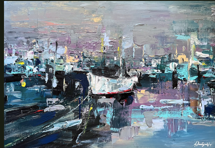
Θα θελα μαζί τους να πάω, κι ούτε πια να γυρίσω (2023, Ακρυλικό σε καμβά 50 x 70 εκ.)