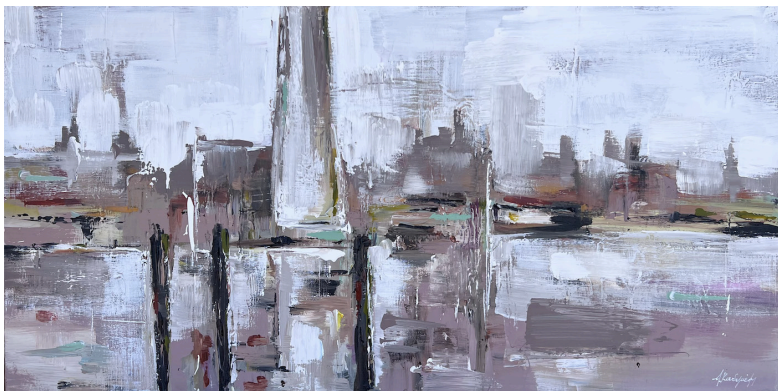
Παράξενο θέλω ν' αρχίσω ταξίδι, χωρίς, μα χωρίς τελειωμό (2023, Ακρυλικό σε καμβά 50 x 100 εκ.)

Το δρόμο μ' αργά να τραβώ, να τραβώ, αλλά πουθενά και ποτέ να μη στέκω, φυγή να μη βρίσκω, ή πάντα να μπλέκω με κόσμο τυφλό και βουβό.