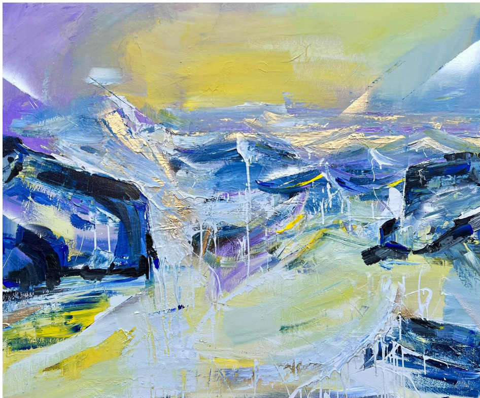
Η μέθη των κοριτσιών (2023, Ακρυλικό σε καμβά 100 x 120 εκ.)