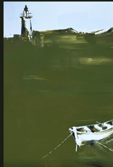
Λές και ἡ θάλασσα κοιμάται μέσ τῆς γῆς τὴν ἀγκαλιά (2023, Ακρυλικό σε καμβά 100 x 70 εκ.)

Δέν ακούεται οὔτ' ἓνα κῶμα εἰς τὴν ἔρμη ἀκρογιαλιά, Λές και ἡ θάλασσα κοιμάται μέσ τῆς γῆς τὴν ἀγκαλιά.