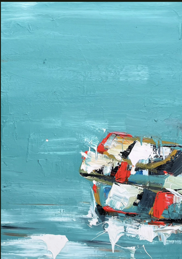
Να φεύγεις από όσα νόμισες γι' αληθινά, μήπως φτάσεις κάποτε σ' αυτά (2023, Ακρυλικό σε καμβά 70 x 50 εκ.)