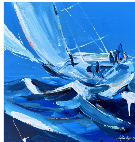
Τοὺς Λαιστρυγῶνας καὶ τοὺς Κύκλωπας, τὸν θυμωμένο Ποσειδῶνα μὴ φοβάσαι (2023, Ακρολικο σε καμβά 40 x 40 εκ.)