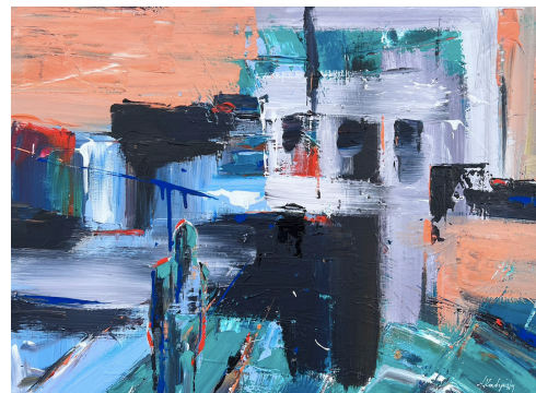
Να μάθεις να φεύγεις από εκεί που ποτέ πραγματικά δεν υπήρξες (2023, Ακρυλικό σε καμβά 50 x 70 εκ.)