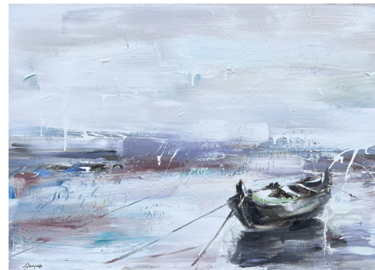
Πώς μ' έσεισε το ζόπνημα μιας νιότης (2023, Ακρυλικό σε καμβά 70 x 100 εκ.)

Σάμπως τα μάτια της να μου είπαν ότι δεν είμαι πλέον ο ναυαγός κι ο μόνος, κι ελύγισα σαν από τρυφερότη, εγώ που μ' είχε πέτρα κάνει ο πόνος.