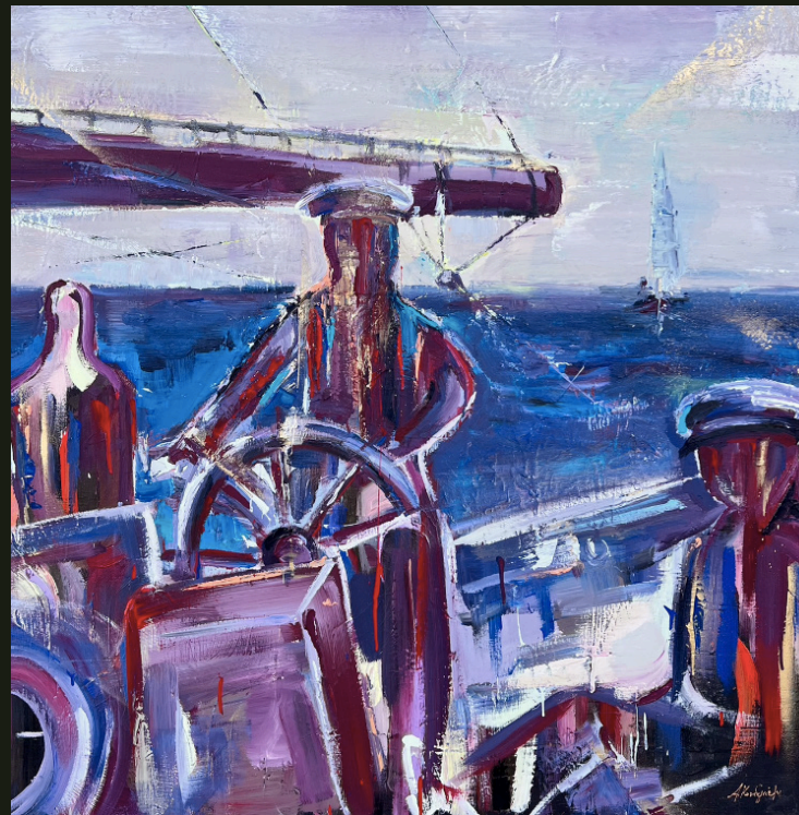
Πάρραμε τη ζωή μας - λάθος! κι αλλάξαμε ζωή (2023, Ακρυλικό σε καμβά 100 x 100 εκ.)

Με τί καρδιά, με τί πνοή, τι πόθους και τί πάθος, πήραμε τη ζωή μας - λάθος! κι αλλάξαμε ζωή.