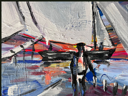
Περιμένω να ζημερώσει για να γεννηθεί ένας νέος θεός μες στην καρδιά μου (2023, Ακρυλικό σε καμβά 30 x 40 εκ.)