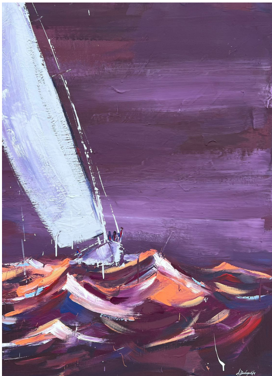
Με τί καρδιά, με τί πνοή, τι πόθους και τί πάθος (2023, Ακρυλικό σε καμβά 100 x 70 εκ.)