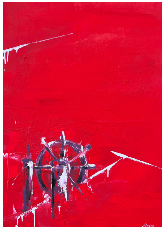
Μακρύ κουραστικό ταξίδι το πεπρωμένο μα το χειρότερο πας ή έρχεσαι δεν ξέρεις (2023, Ακρυλικό σε καμβά 100 x 70 εκ.)

Όλοι κοιμούνται κι εγώ ζαγρυπνώ περνώ σε χρυσή κλωστή ασημένα φεγγάρια και περιμένω να ζημερώσει για να γεννηθεί ένας νέος θεός μες στην καρδιά μου την παγωμένη από άγρια φαντάσματα και τη μαύρη πίκρα.