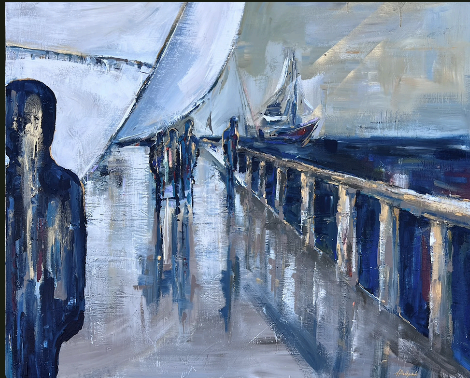
Αγάπη, από σε να χαθώ! (2023, Ακρυλικό σε καμβά 100 x 120 εκ.)

Ε! ίσως σε τέτοιο ταξίδι αν βρεθώ, ατέλειωτο, έρμο, σ' αγνώριστη χώρα, δε θα 'χω περίσσια λαχτάρα σαν τώρα, Αγάπη, από σε να χαθώ!