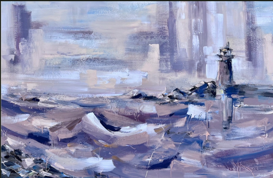
Να ελπίζεις (2023, Ακρελικό σε καμβά 100 x 150 εκ.)