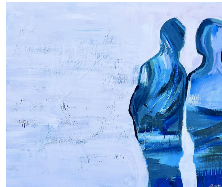
Ἔτσι σοφὸς ποὺ ἔγινες, μὲ τόση πείρα, ἤδη θὰ τὸ κατάλαβες ἢ Ἰθάκες τί σημαίνουν (2023, Ακρολικο σε καμβά 100 x 120 εκ.)