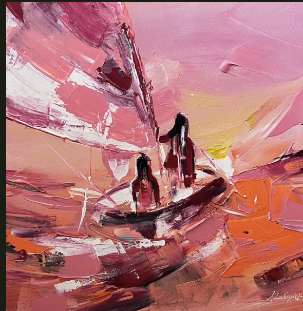
Μια γεύση τρικυμίας στα χείλη (2023, Ακρυλικό σε καμβά 50 x 50 εκ.)

Στιλωμένη στους βράχους δίχως χτες και αύριο. Στους κινδύνους των βράχων με τη χτενισιά της θύελλας Θ' αποχαιρετήσεις το αίνιγμά σου.