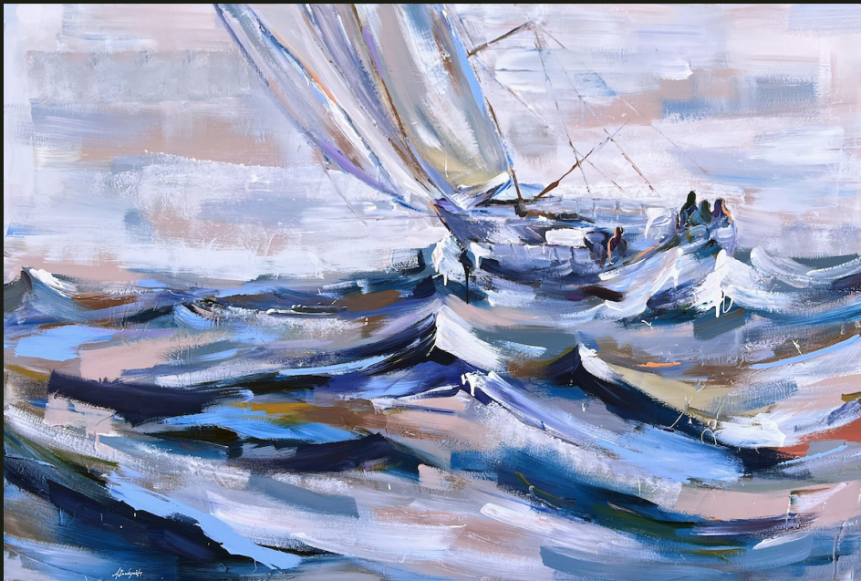
Η θάλασσα είναι σαν τον έρωτα: μπαίνεις και δεν ξέρεις αν θα βγεις (2023, Ακρυλικό σε καμβά 100 x 150 εκ.)