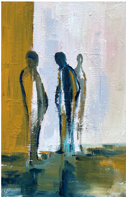
Πριν από εσένα ήσουν εσύ; (2023, Ακρυλικό σε καμβά 80 x 60 εκ.)