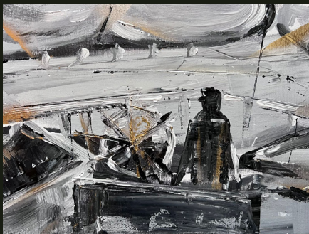
Περνώ σε χρυσή κλωστή ασημένα φεγγάρια (2023, Ακρυλικό σε καμβά 30 x 40 εκ.)